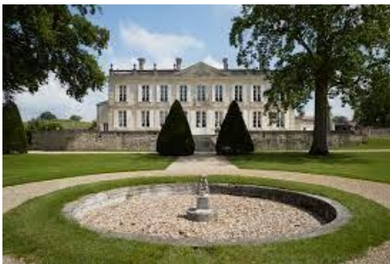
CHATEAU DE LA DAUPHINE

09h30-16h00 : Visite de Saint-Emilion suivie d'un déjeuner au château de La DAUPHINE