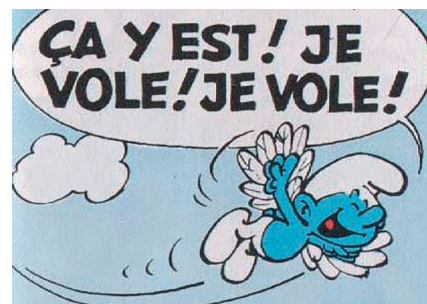
Le Schtroumpf volant (extrait de la bande dessinée créée par Peyo).

Raphaël Enthoven a également mentionné l'homme politique Pierre Poujade, qui, selon lui, « a donné ses lettres de noblesse à la haine de la no-