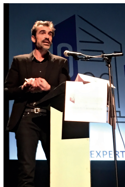
Raphaël Enthoven, professeur de philosophie.

L'expert a ainsi mauvaise presse parce qu'il passe pour froid. On s'attaque à l'expertise comme on défendrait la sensibilité contre la froideur d'un savoir. Raphaël Enthoven précise : « L'expert est celui qui, dans l'esprit de celui qui veut le mépriser, réduit le réel, la