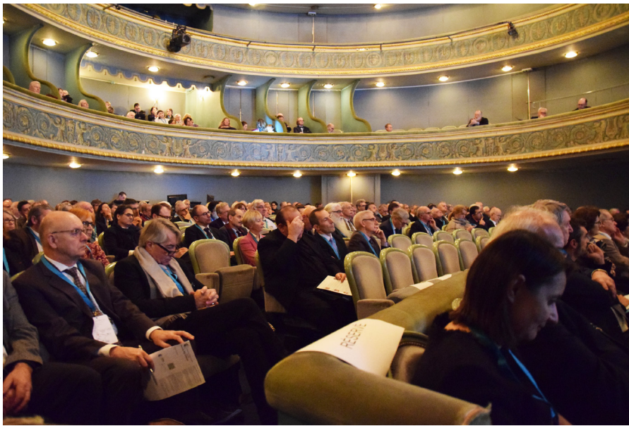
Le colloque de la Compagnie des experts près la cour d'appel de Versailles s'est déroulé au théâtre Montansier.